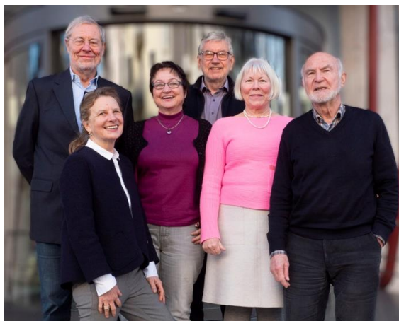
Der neue SEC-Vorstand am 23 Jan 23 vor der GDCh-Geschäftsstelle in Frankfurt