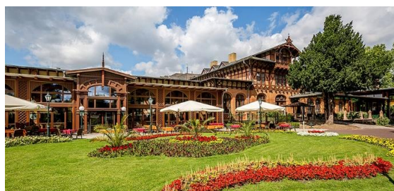
Dorint Hotel "Herrenkrug", Magdeburg