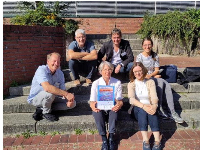
Sonnige Pause mit dem SETAC GLB-Vorstand

Ein Plenarvortrag zum Thema „Mikroplastik in der Umwelt: Kleine Partikel, großes analytisches Problem?“ durch Sebastian Primpke (AWI, Helgoland) lockte dann am Mittwochmorgen alle wieder zurück in den Hörsaal. Die anschließenden Diskussionen in den Parallelsessions drehten sich um ökotoxikologische Fragestellungen, den Transport von Chemikalien über den Atmosphärenpfad, Leitplanken und Grenzlinsen, und auch eine Session speziell zu Moosen wurde angeboten.