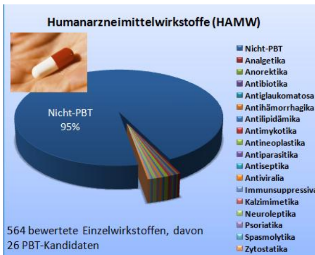
Abb. 2: Identifizierung von Humanarzneimittelwirkstoffen als potentielle PBT-Stoffe