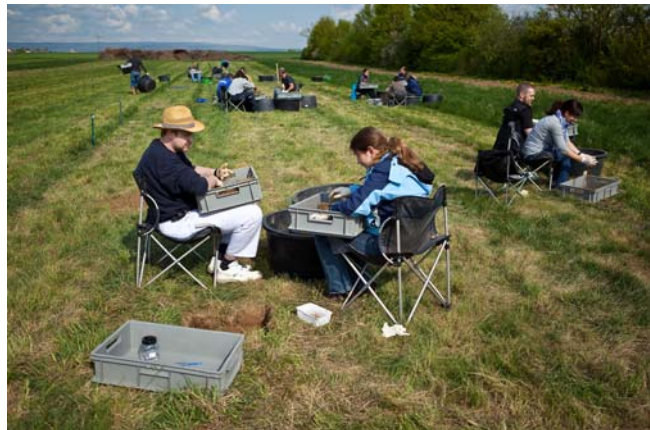
ECT-Feldstudie zur Feststellung von Auswirkungen von Pflanzenschutzmitteln auf Regenwurmpopulationen

Mitarbeiter der ECT sind in wissenschaftlichen Organisationen wie der SETAC und der Fachgruppe Umweltchemie und Ökotoxikologie der GDCh aktiv. Weitere Informationen über die ECT können auf der neu gestalteten Website ( www.ect.de ) abgerufen werden.