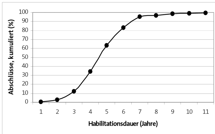
Abbildung 2: Kumulierte Habitationsdauer

organische (einschließlich analytische) Chemiker habilitieren mit 5,0 und 5,1 Jahren im Schnitt am schnellsten, Physikochemiker benötigen mit 5,5 Jahren etwas länger. Die von 38 Befragten angegebene Fachbezeichnung „Chemie“ läßt keine weitere Interpretation zu, weswegen die kurze Durchschnittsdauer von nur 4,7 Jahren in dieser Gruppe nicht weiter untersucht werden kann.