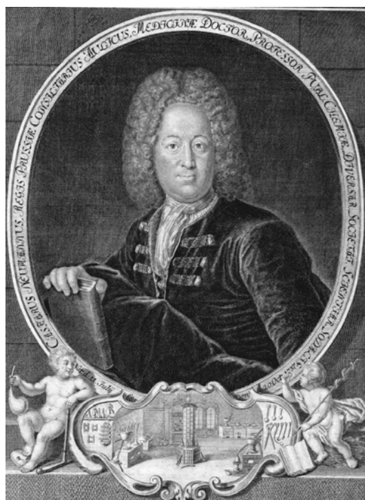
Abb. 5: Caspar Neumann (1683-1737), Berliner Apotheker und Chemiker, übermittelte 1723 das Rezept zur Herstellung des Berliner Blau an John Woodward in London.

by ein eigenes chemisches Laboratorium betrieb. Neumann musste täglich im Auftrag seines Arbeitgebers experimentieren, die Versuche dokumentieren und mit ihm besprechen. Neumann lernte schnell Englisch, kam in Bekanntschaft mit vielen Chemikern, Ärzten, Apothekern und anderen Gelehrten und wurde auch zu Zusammenkünften der Apothekergilde und der Royal Society, der damals bedeutendsten gelehrten Gesellschaft Europas, eingeladen. Da er jetzt ein geregelt, gutes Einkommen hatte, in Gelehrtenkreisen sehr geachtet war und sich auch ansonsten in London sehr wohl fühlte, beschloss Neumann, in England zu bleiben. Allerdings wollte er noch einmal nach Berlin reisen, um dort seine persönlichen Angelegenheiten zu regeln. Dabei traf er mit dem einflussreichen Georg Ernst Stahl zusammen. Stahl erkannte bei Fachgesprächen schnell, was für ein talentierter und inzwischen auch erfahrener Chemiker und Apotheker Neumann war und versuchte ihn für Berlin zurückzugewinnen. Das gelang auch, indem er ihm für die Zukunft den Chefposten in der Hofapotheke anbot und für die nächste Zeit die Fortsetzung seiner Bildungsreise bei erneuter Übernahme der Kosten durch den König. Neumann konnte dieses Angebot nicht ausschlagen und ging noch 1716 als erstes wieder nach England. Von Anfang 1719 war Caspar Neumann dann bis zu seinem Tod 1737 Leiter der Berliner Hofapotheke.