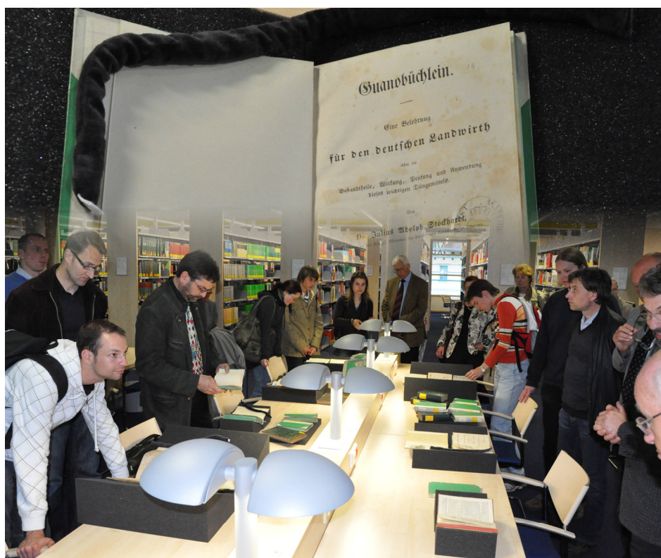
Abb. 2: In der Bibliothek in Tharandt – die Teilnehmer des Rundgangs bestaunen Stöckhardts Werke, unter anderem das Guanobüchlein, als Belehrung für die Deutschen Landwirte, das die Bedeutung der Stickstoffdüngung erklärt.

Stöckhardt-Clubs und des Schülerwettbewerbs wiederbelebt hat, stellte Stöckhardts Wirken für die Industrie und die Umwelt dar.