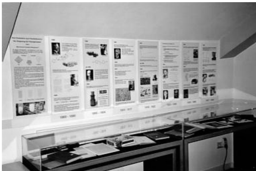
Abb. 1: Längs eines Zeitbandes zeigen Schautafeln die Geschichte der Flüssigkristall-Forschung; historische Exponate begleiten diesen Weg in Vitrinen.

Kristallen“, die sowohl eine Anisotropie physikalischer Eigenschaften wie eine Fluidität auszeichnet. 2