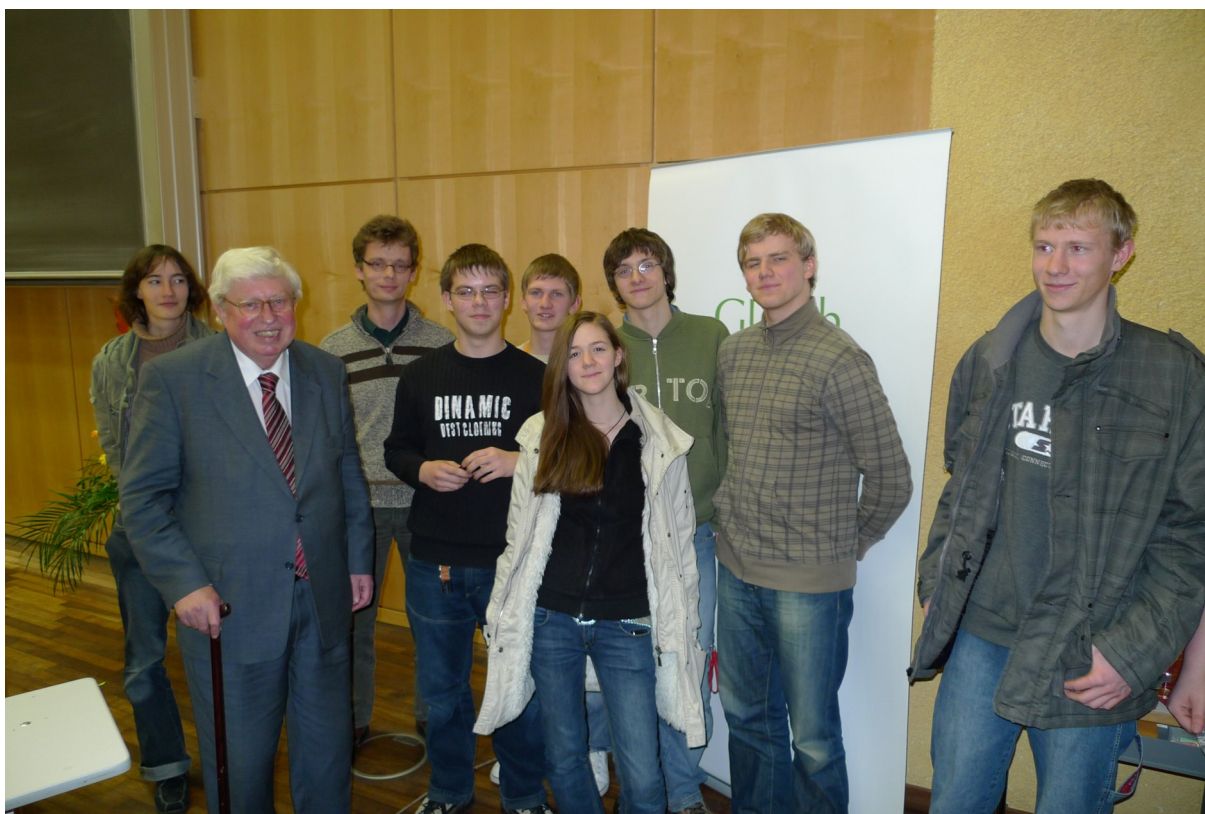
Abb. 1: Prof. Dr. Dr. h. c. mult. Gerhard Ertl mit einer Schülergruppe beim Stöckhardt-Festkolloquium am 15.01.2009 an der TU Chemnitz.